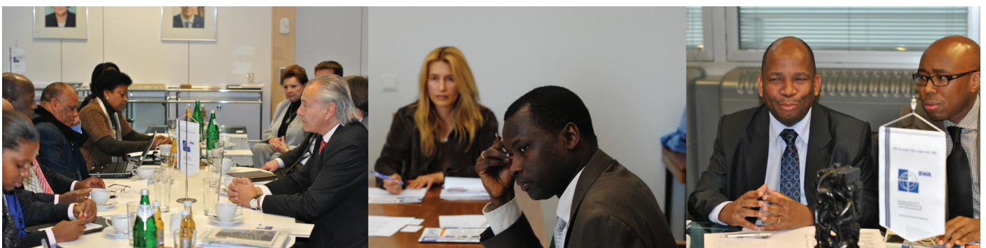
Botschaftergespräche des BWA