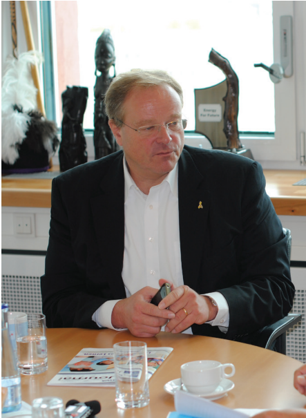
Bundesminister für wirtschaftliche Zusammenarbeit und Entwicklung, Dirk Niebel

Interview mit dem Bundesminister für wirtschaftliche Zusammenarbeit und Entwicklung, Dirk Niebel